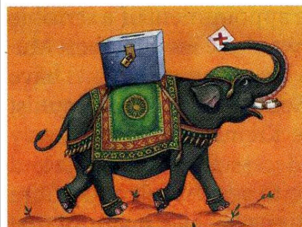
Tidskriften Economist bild av de indiska valen.

I svenska massmedia är valen år 2009 de första som har skildrats på bred front, och där man också har skildrat den politiska betydelsen av valet. Rapporterna från tidigare val har mest handlat om exotism (se bilden ovan) och om hur det kan komma sig att fattiga människor går och röstar. b Tidskriften Economist har inte riktigt hängt med på att man numera använder elektroniska valmaskiner i Indien - i motsats till i England.